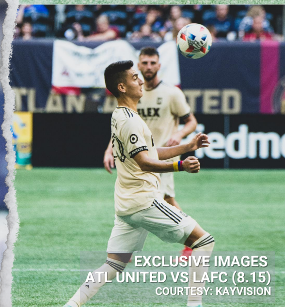
EXCLUSIVE IMAGES ATL UNITED VS LAFC (8.15)